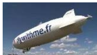
A Parigi turisti in volo con il dirigibile sull... Guarda il VIDEO