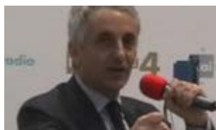
Quagliariello: C'era piano pronto per far saltare... Guarda il VIDEO