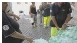
Allarme caldo a Roma, protezione civile in campo Guarda il VIDEO