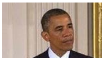
Usa, Obama compie 52 anni, ma l'allerta Guarda il VIDEO