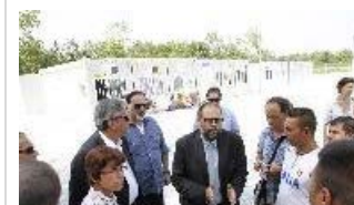
06/08/2013 Nomadi trasferita in Centro d'accoglienza in via Lombroso