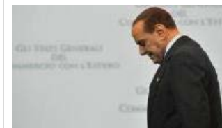
06/08/2013 Jack Nicholson sarà Berlusconi: parola di bookmakers