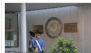
06/08/2013 Allarme bomba al consolato americano di Milano